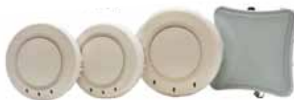
Det trådløse wifi-netværk fra »Trapeze Networks« er første led i standardisering og konsolidering af regionens it-struktur. Det tværgående projekt skal nu til at se på bl.a. printere og pc'ere til medarbejderne, der betjener omkring 1,2 mio. indbyggere.